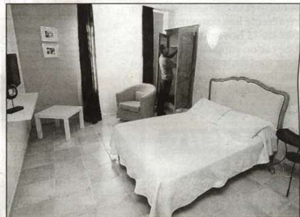
Les aménagements extérieurs et intérieurs comme les chambres, l'accueil et le service aux clients répondent à la nouvelle grille d'évaluation et ses 245 critères.

Hôtel du Parc, 21 bd de la Liberté à Draguignan. Téléphone : 04.98.10.14.50. E-mail : www.hotel-duparc.fr